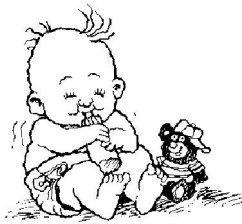
el bebé (the baby)

El pastor El papá La mamá El bebé El profesor La familia El animal El elefante El mosquito El tigre El dinosaurio El chocolate El cereal El sandwich El menú La banana La hamburguesa El hotel El restaurante La fiesta La música El piano La televisión La gasolina La ambulancia La secretaria